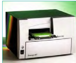
8. Messsignal auslesen