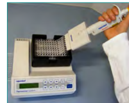
6. Waschen (Entfernen ungebundener Komponenten, 2x 1 min)