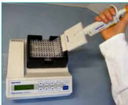
4. Immobilisierung (Binden des „Sandwichs“ an Bindeplatte, 10 min)