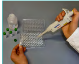
5. Enzymreaktion (Kopplung des Enzyms an das Sandwich, 10 min)