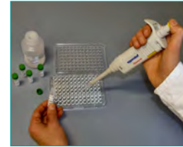
3. HybriScan®-Testlösung (Binden der Probe an spezifische Sonden, 10 min)