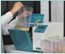
1. Probenvorbereitung & Anreicherung (optional)