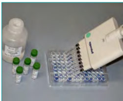
7. Nachweisreaktion (Farbreaktion und Abstoppen, 10 min)